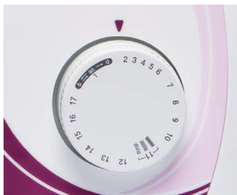
Commande simple de sélection des points