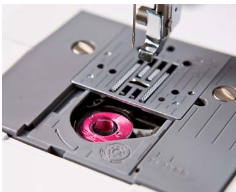
Mise en place rapide de la canette