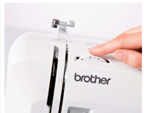
Ajustement de la tension du fil

Pour plus d'informations, contactez votre spécialiste ou rendez-vous sur www.brothersewing.eu .